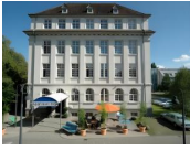
Konstanz - Apartment Hotel Konstanz*** Konstanz - www.apartment-hotel-konstanz.de