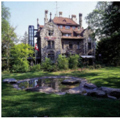
Schaffhausen - Park Villa Schaffhausen Schaffhausen - www.kronenhof.ch