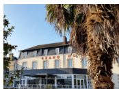
Mayenne - H♦el Le Grand H♦el de Mayenne www.logishotels.com