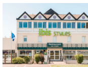
Ouistreham - H♦el Ibis Style Ouistreham www.all.accor.com/hotel/1967