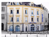
Laval - H♦el Marin www.marin-hotel.fr