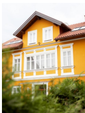
Salzburg - villaceconi.at www.villaceconi.at