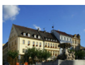
Děčín - Hotel Česká Koruna*** www.hotelceskakoruna.cz