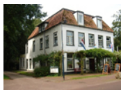
Rijs - Hotel Jans*** www.hoteljans.nl