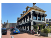
Sneek - Stadsherberg Sneek www.stadsherbergsneek.nl