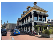
Sneek - Stadsherberg Sneek www.stadsherbergsneek.nl