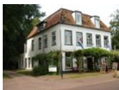
Rijs - Hotel Jans*** www.hoteljans.nl